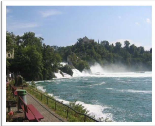
Cascate del Reno